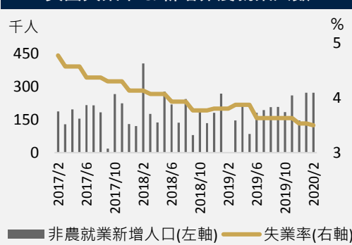
美國失業率 & 新增非農就業人數